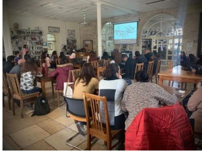
اجتماع طاقم المدرسة الثانوية للبحث في أسلوب التوعية

الرعاية... ماذا يعني أن تمارس الرعاية في مؤسسة تربوية؟ أليست التربية نوعاً من الرعاية بشقيها الأكاديمي والسلوكي؟