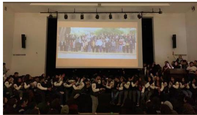
طلاب صف 2020 في آخر اجتماع صباحي لهم قبل بدء الامتحانات التجريبية

أكتب إليكم بعد عودتي من ملبورن حيث ابنتي تدرس الآن في الجامعة. إنها لحظة فخورة حين تشاهد ابنتك الوحيدة وهي تنتقل إلى مرحلة أخرى من الحياة - وهي تدرس تخصصاً لطالما أحبته وتنتقل إلى سكن طلابي جامعي وتلتقي أصدقاء جدد وتبني علاقات مترابطة.