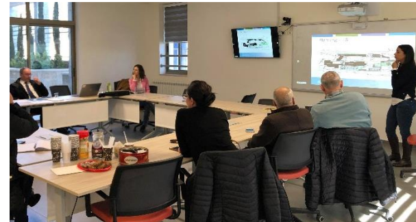
اجتماعات لجنة احتفالات الذكرى الـ150

يسرني الترحيب بمجتمع المدرسة في الفصل الدراسي الجديد. إن سنة 2019، سنة مميزة في تاريخ مدرسة الفرنز، حيث تحتفل المدرسة هذا العام بالذكرى الـ 150 على تأسيسها. هذا الوقت هو الوقت المثالي للمجتمع المدرسي للتفكير من أين أتت الفرنز وما هو مستقبلها. كجزء من احتفالات الذكرى الـ 150 تعمل المدرسة على تحضير صندوق زمني سيتم حفظه تحت الأرض في واحد من حرمي